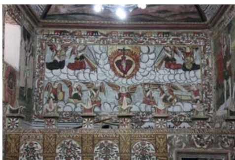
Representación del coro alto, con maestro cantor y músicos, Pachama. Curahuara de Carangas, ángeles músicos en coro alto. Ambas del s. XVIII.