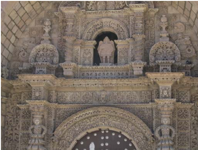
Portada principal de San Lorenzo en Potosí.

llador y orfebre, famoso por su pintura y escultura. La inscripción en su portada es de los años 1728 a 1744 (Gisbert y Mesa 1997: 35). Gisbert sostiene que la asociación del pez del Titicaca con la sirena sería la causa de la proliferación de la sirena en la decoración andina (Gisbert 2004). Sin embargo, María Isabel Rodríguez y Margarita Vila da Vila enfatizan el origen medieval y la representación de sirenas con instrumentos —como el laúd (origen del charango)— en iglesias medievales, dando como ejemplo la sirena que se ubica en el coro de la catedral de Basilea (Suiza). La proliferación podría deberse a copias de grabados o libros iluminados medievales. No se debe dejar de mencionar la asociación de agua y «sirenu» (o «sireno») en el ámbito surandino, dios prehispánico que permite la afinación de instrumentos, lo que podría otorgarle a la sirena su especial proliferación (Millones y Tomoeda 2004).