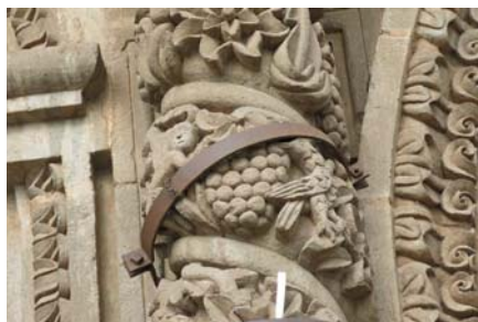
Portada de Puno. Sirena tocando laúd o charango; en la columna helicoidal derecha (desde el observador), un mono toca el racimo de uva.

b. Pomata. Al sur del Perú se ubica el pueblo de Pomata. Su nombre significa «guardia del puma», en quechua y aimara. Fue una importante parada en el tránsito en tiempos prehispánicos, destacado asiento lupaca que perteneció al obispado de La Paz.