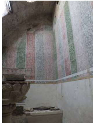
Bautisterio. Murales del XVIII.