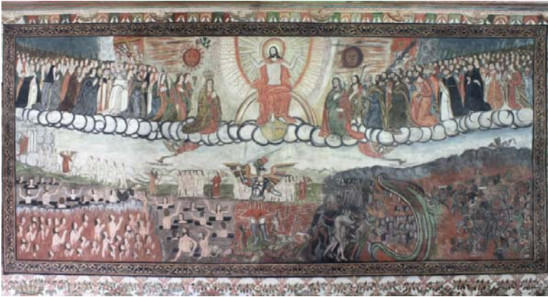
Juicio Final en Curahuara de Carangas (1608) con repintes del s. XVIII.