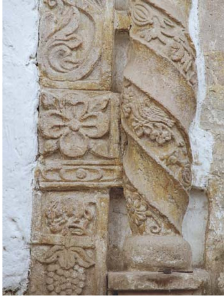
Detalle del pilar que flanquea la columna izquierda, desde el observador; sobre el racimo de vid, una vizcacha.