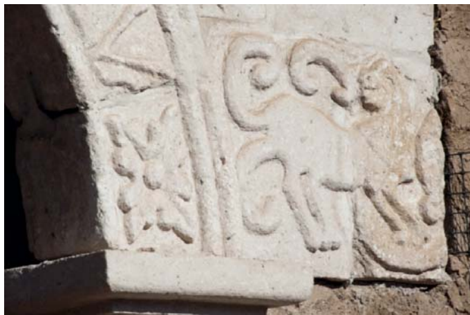
Detalle de la portada lateral, Socoroma.

La portada lateral del templo es uno de sus elementos más valiosos, representante del estilo surandino propio del siglo XVIII. El vano de la puerta de madera de dos hojas está flanqueado por pilastras de piedra labrada, con arco de medio punto que contiene una inscripción ilegible; se reconoce el anagrama de María (MAR), del Espíritu Santo, números romanos como el LV (55) y una pequeña cabeza de ángel alado en la clave. Las pilastras presentan ornamentación vegetal y la figura de dos leones, expeliendo fuego a cada costado, similar tipología a aquellos ubicados en las orlas de la fachada principal de Puno. El portal se volvió a colocar luego de una reconstrucción, se deduce que con desconocimiento del calzado original de las piezas de piedra labrada (Pereira 2013).