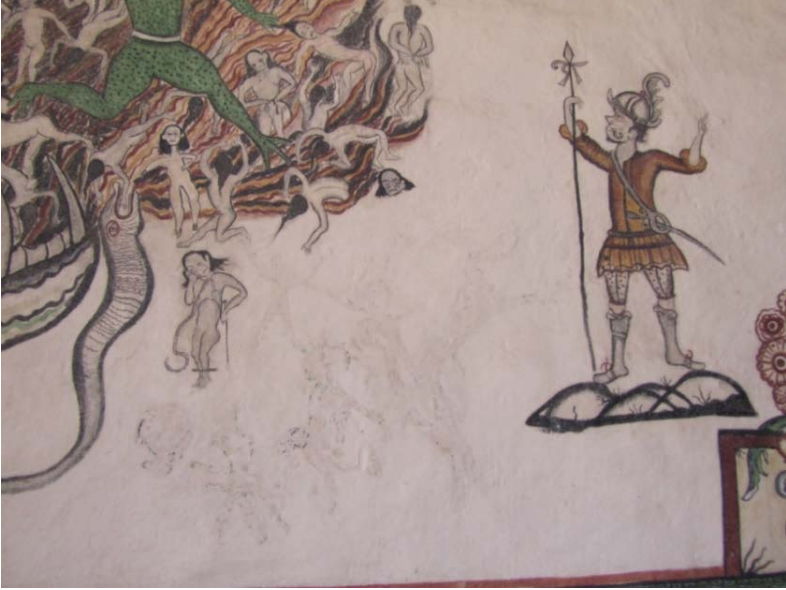
Detalle del Juicio Final, acceso de la nave, muro del Evangelio. Un cacique en el lado de los condenados, lleva atado en su cuello una piedra horadada.

pecho, mismas piedras que es posible encontrar hoy en uno de los calvarios, ubicado en la cima del cerro, frente al acceso del templo.