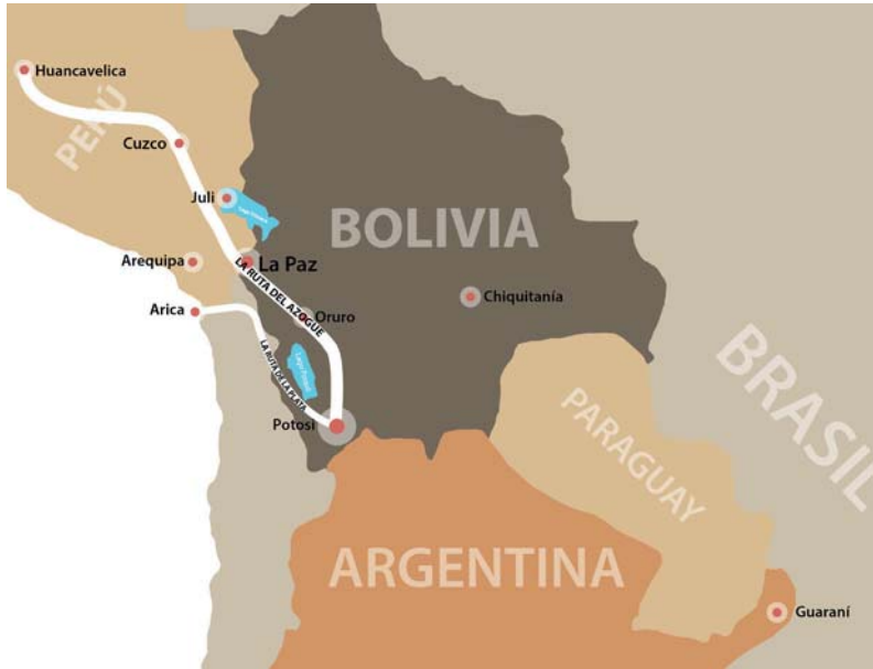
Ilustración con ubicación de templos y rutas en el ámbito surandino.

de la plata, desde 1574 (Casassas Cantó 1974: 217-218; Glave 1989; Serrera 1999: 156; Tandeter 1992; Moreno y Pereira 2011: 28-29).