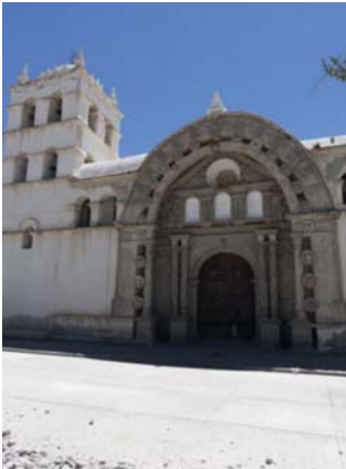
Tomahave. Portada principal.

En el bautisterio hay escenas similares a las del baptisterio de la iglesia de Carabuco, del siglo XVIII. Los muros representan textilería a modo de tapices. El arco que cubre la escena principal también presenta su rosca con el mismo tipo de decorado con «hombres verdes» en las enjutas. La escena principal es «el bautismo de Cristo» bordada con imitación de marco de madera tallado (Jemio 1998: 225-227). La pintura fue realizada por Blas de Ortis, encargada por Joseph Miranda, según consta en un contrato que se efectuó en La Plata en 1725-1726. 15