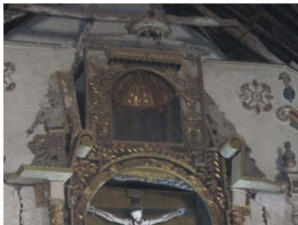
Detalle del altar mayor, tritón o sirena con racimo de uva y mono. Retablo Cosapa.

h. Curahuara de Carangas. Se encuentra en el altiplano andino, en la provincia de Sajama, Bolivia, a 4000 m s. n. m. (Jemio 1998: 150). Fue doctrina dentro del obispado de Charcas. Los carangas formaban parte de un señorío aimara independiente que abarcaba varios pisos ecológicos.