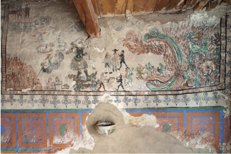
Juicio Final, muro de la epístola, templo de Parinacota. El marco repite la decoración de flor de lis, como en otros templos de la ruta durante el s. XVIII.