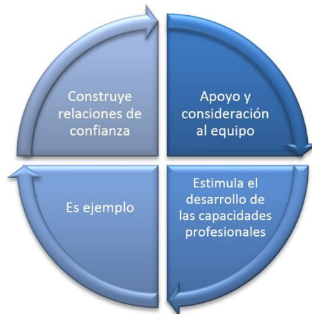
Figura 6. Prácticas de la construcción de relaciones y desarrollo profesional.

Las cuatro prácticas que conforman esta dimensión tienen un impacto directo sobre la motivación de los equipos (véase figura 6). Estas prácticas buscan construir capacidades en la escuela en cuanto a conocimientos, habilidades y disposiciones o motivaciones (Newmann, King, & Youngs, 2000). Lo que se busca al trabajar sobre las motivaciones es que los equipos persistan en el desarrollo de las nuevas habilidades y en la aplicación de esos nuevos conocimientos.