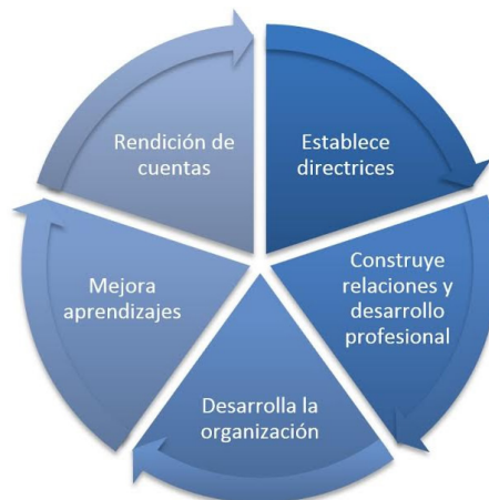
Figura 4. Dominios de la acción directiva eficaz.

Las prácticas que se proponen no están alineadas con alguna teoría específica de liderazgo, puesto que ninguna puede abarcar la totalidad de la acción directiva. Esto significa que refleja diversos tipos de liderazgo como el transformacional, el distribuido y el pedagógico, buscando constituirse en un modelo integrador.