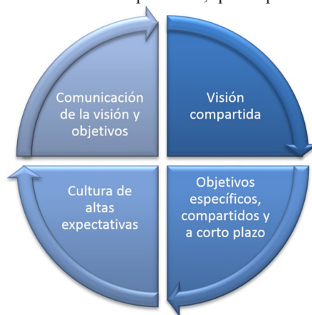
Figura 5. Prácticas del establecimiento de directrices.

Este primer dominio se divide en cuatro prácticas, que se pueden apreciar en la figura 5.