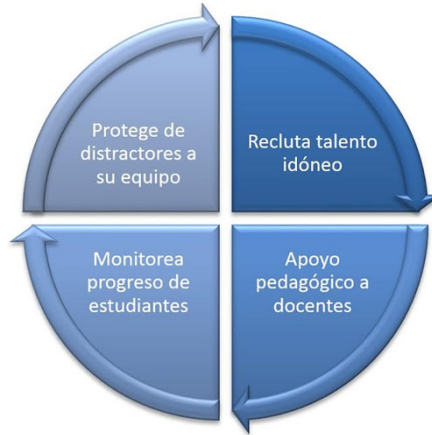
Figura 8. Prácticas de la mejora de los procesos de aprendizaje.

Si bien el núcleo de su tarea es generar aprendizajes, en el cuadro se ha visto que los dominios previos se han referido a la generación de las condiciones organizacionales y culturales para una mejora de los aprendizajes. En este acápite las prácticas del directivo van en la línea de apoyar a los docentes a realizar lo mejor posible su tarea (figura 8).