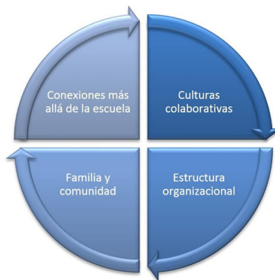
Figura 7. Prácticas del desarrollo de la organización.

Para convertir cada escuela en una escuela de excelencia es necesario rediseñar determinados procesos y acciones de la presentes en ella, lo cual implica desde el sistema de evaluación hasta replantear la acción del maestro durante los recreos. A esto se le llama infraestructura escolar (Newmann et al., 2000). Es necesario convertirla en una comunidad profesional de aprendizaje (DuFour, DuFour, & Eaker, 2009; DuFour & Eaker, 1998). Una escuela tendrá cada vez mayores logros de aprendizaje si convierte la colaboración en el núcleo de sus prácticas e interacciones entre todo su personal. Muchas veces el origen de la resistencia al cambio más que el docente en sí es la infraestructura o condiciones de trabajo de la escuela. Cuando dicha infraestructura no está alineada con los objetivos socava la motivación docente (véase figura 7).