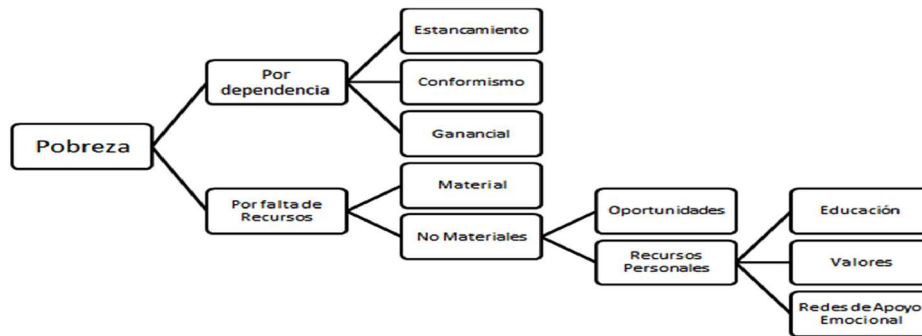
Figura 2. Percepción de pobreza

personas que son percibidas como flojas y que no se esfuerzan para conseguir sus metas y concretar sus proyectos, que no tienen aspiraciones ni experimentan crecimiento personal, y que, a la luz de los resultados de este estudio, se ve influido por el conformismo y la actitud ganancial de las personas consideradas pobres y que, según algunos autores, se relaciona exclusivamente a factores ligados a un capital humano insuficiente (Leiva & Parra, 2011)